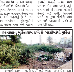
નક્તિધામના ચાલવાની જગ્યાએ ગંદકી સર્જાય છે ચોમાસા દરમિયા પુકાર્યા પૈયા પાલ પાય કે બધાળ પટકા સહાવ છે પાયાસ દરાવવા ડાઘુઓને ચાલવામાં થાય છે પરેશાની ત્યારે નખત્રાણા પાલિકા દ્વાર સાફ સફાઈ મુક્તિ ધામ ગંદકી ધામ બનતું અટકે તેવી માંગ ઉઠી છે